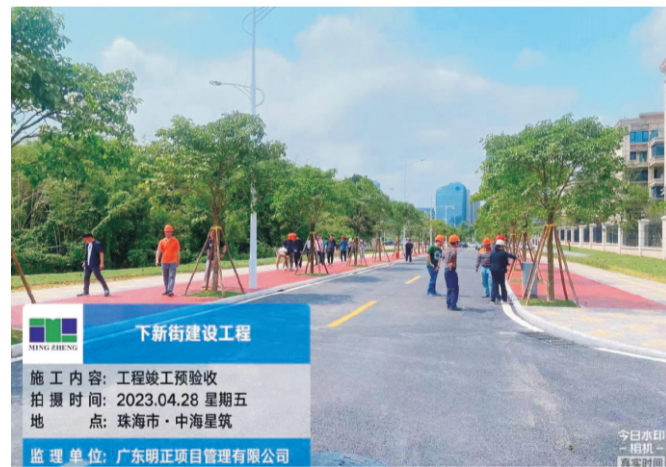
下新街建设工程 施工内容: 工程竣工验收 拍摄时间: 2023.04.28 星期五 地点: 珠海市·中海星筑 监理单位: 广东明正项目管理有限公司

由我公司监理的下新街建设工程位于珠海高新区信息港及赛车场北侧, 恒大云锦花园东侧, 为新建市政道路, 道路等级为城市支路, 设计起于金园路、终于下横街(规划道路), 本道路红线18米宽, 双向两车道, 设计车速30km/h, 建设长度约176.68米。主要内容有道路工程、污水工程、雨水工程、给水工程、缆线管廊工程、照明工程、交通设施、安监设施、绿化景观工程, 并预留燃气管位等。