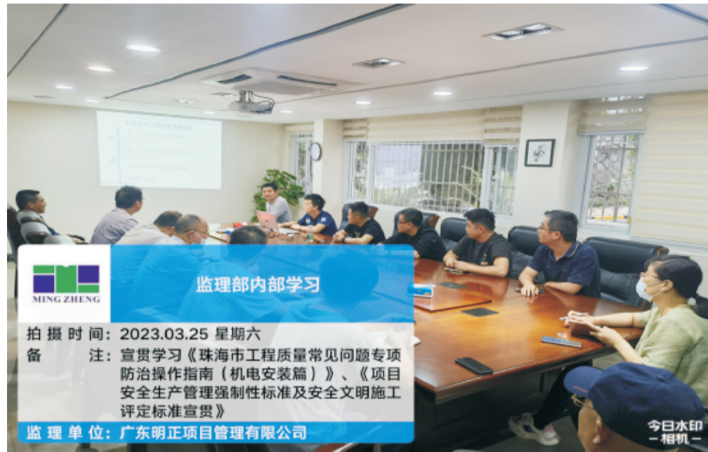
监理部内部学习 拍摄时间: 2023.03.25 星期六 注: 宣贯学习《珠海市工程质量常见问题专项防治操作指南(机电安装篇)》、《项目安全生产管理强制性标准及安全文明施工评定标准宣贯》 监理单位: 广东明正项目管理有限公司

第三章消防工程施工质量通病: (1) 喷淋管卡箍配件品牌、标识及外观与样板审批不符, (2) 喷淋管切割面存有飞边、毛刺, (3) 喷