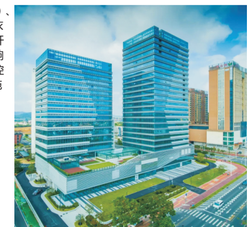
金鼎第一工业区更新项目

自从2022年底该海绵设施建成以来，其生态环境效应已经充分体现出来。从经历今年几次大雨的现场观测来看，真正做到了“小雨不湿鞋，大雨不积水”。雨水花园和绿色屋顶的植物生长都比种植土的植物健康，生物多样性也体现在昆虫出现的频率和数量上。由于不存在积水，项目现场几乎没有蚊虫。该项目有效促进珠海市生态文明建设，保护高新区生态环境，有效增强城市魅力、促进产业升级进程，对区域经济发展及社会可持续发展起到积极的作用。